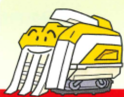
自脱型・普通型コンバイン