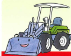
農業用ホイールローダー