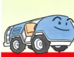
自走式スピードスプレー (ブームスプレーを含む)